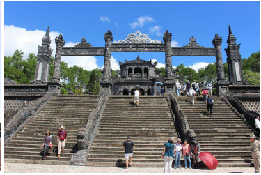
フエ:カイディン帝廟