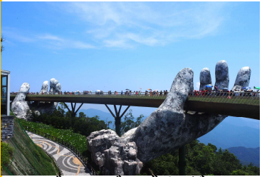
ゴールデンブリッジ

ここ数年人気が高いベトナム中部の中心都市ダナンを観光！海拔1487Mに立つテーマパーク「バーナーヒルズ」にある通称“神の手”と言われるゴールデンブリッジに大理石でできた山「五行山」へ訪れます。