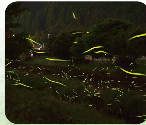
③津具地区のホタル (第9回)