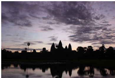
アンコールワットの夜明け