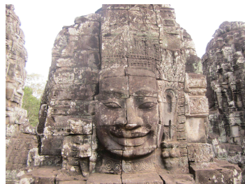
アンコールトムのバイヨン寺院

クメール文化の珠玉！密林に眠る世界最大級の仏教寺院『アンコールワット』を有するカンボジア王国。朝日に染まるアンコールワットや回廊を埋め尽くすレリーフの数々は想像の範囲を大きく超えるまさに“圧巻”です。今回は2日間かけて世界文化遺産アンコールワット寺院とその周辺に点在するアンコール遺跡群を巡ります。