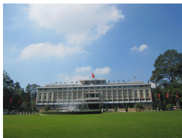
ホーチミンの統一会堂