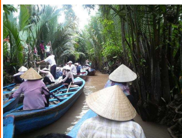
メコンデルタクルーズ