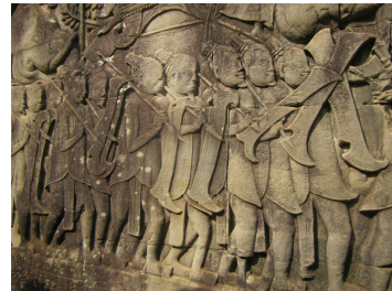
アンコールワットのレリーフ群