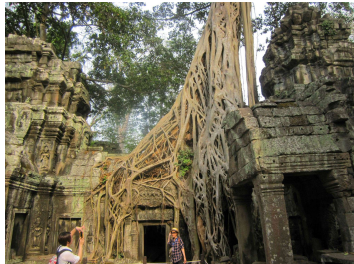
木の根に覆われたタ・プロム寺院