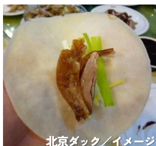
北京ダック/イメージ