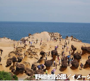
野柳地質公園/イメージ