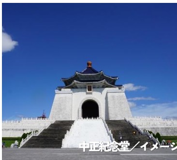
中正紀念堂/イメージ

台湾最大の都市であり、経済、政治、文化の中心地である台北を観光♪ 一糸乱れぬ動きの衛兵交代で有名な忠烈祠や、台北最強のパワースポットである龍山寺、台湾最大の公共建築物の中正紀念堂など台北の人気観光地をめぐります！