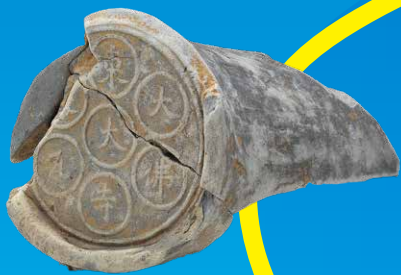
東大寺の屋根をふくために焼かれた瓦 (鎌倉時代初期、伊良湖東大寺瓦窯跡)