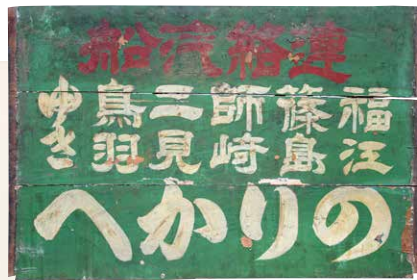
福江・鳥羽等方面行き汽船看板(大正時代、蒲郡市博物館蔵)