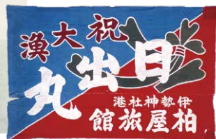
伊勢神宮近くの宿屋から贈られた大漁旗