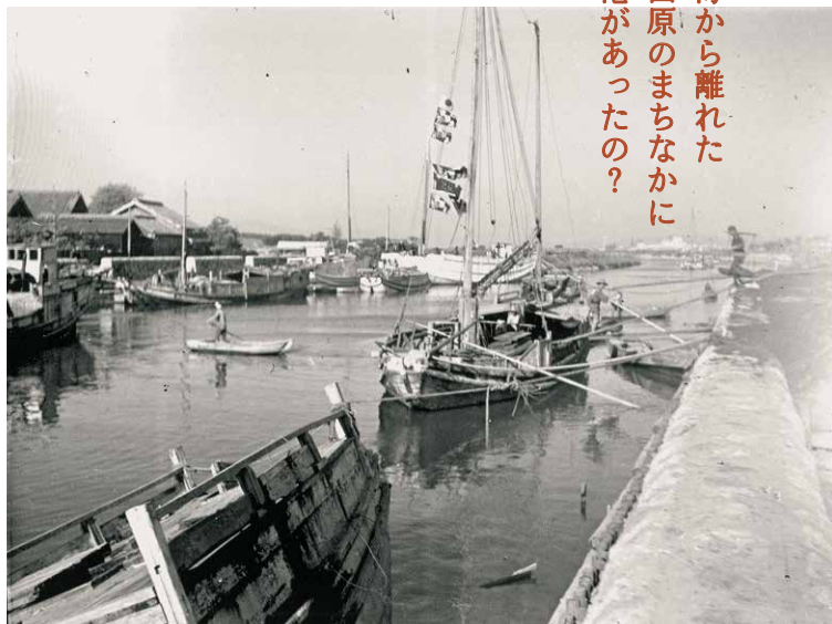
旧田原港(昭和時代初期)