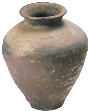
日本の各地に運ばれた渥美半島産のやきもの(鎌倉時代初期、坪沢10号窯)