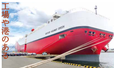
トヨタ自動車田原工場ヤード(現代、トヨタ自動車株提供)