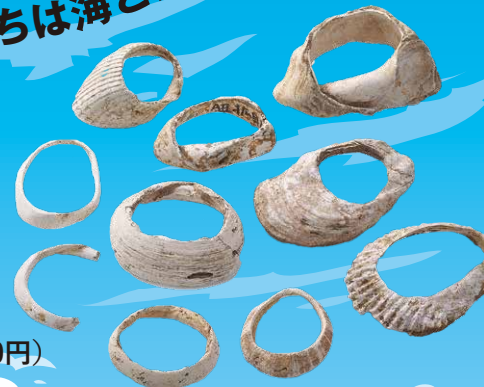
縄文人のアクセサリーだったオオツタノハ ベンケイガイなどの貝輪 (縄文時代晩期、伊川津貝塚ほか)