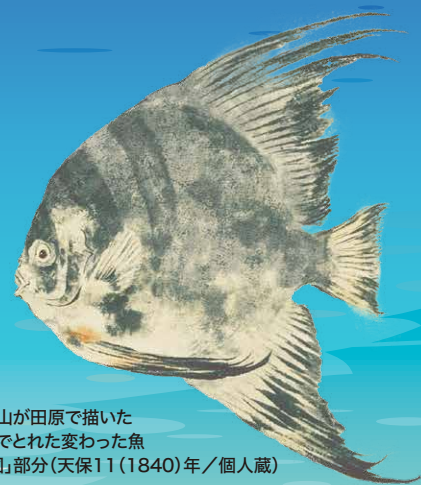
渡辺崋山が田原で描いた 太平洋でとれた変わった魚 「異魚図」部分(天保11(1840)年/個人蔵)