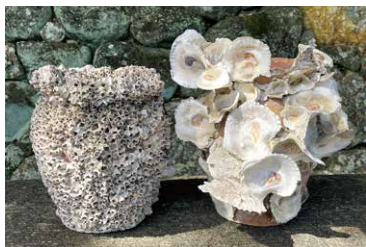
貝がびっしりついたたこつぼ(昭和時代、六連町で使用)