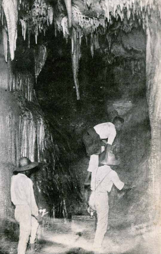
田原市白谷町にあった鍾乳洞(昭和時代初期)

この展覧会では渥美半島の人たちと海の間わりの歴史を「海から広がる」をテーマに、過去から現在まで見ていきます。渥美半島と海のお話をお楽しみください。