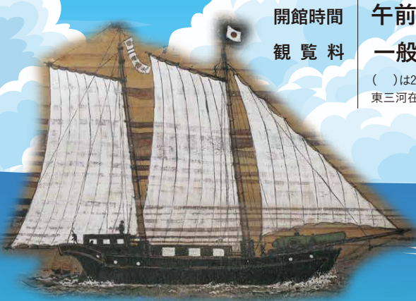
井上親画 田原藩が建造した西洋式帆船図