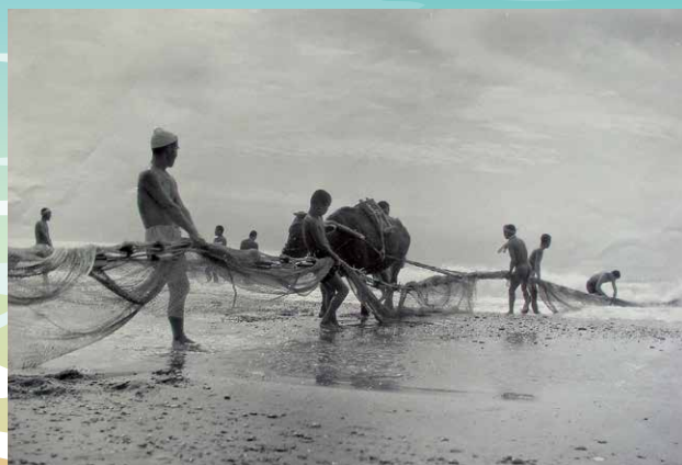
地引網のようす (昭和時代初期、鈴木政一氏撮影/個人蔵)