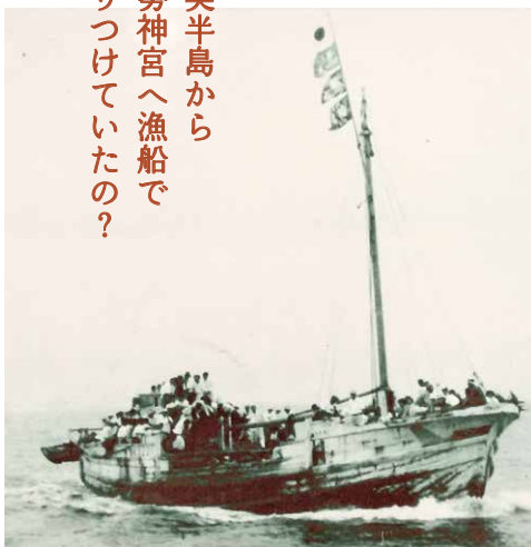
伊勢神宮へ向かう漁船(昭和時代前期)