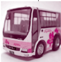
「エアロエース・アゼリア」チョコQ

豊鉄観光オリジナルグッズや、 各地のホテル・旅館・土産物店から 特産品土産物など毎月抽選でプレゼント