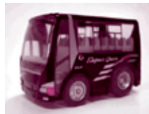
「エレガンスクイーン」チョコQ